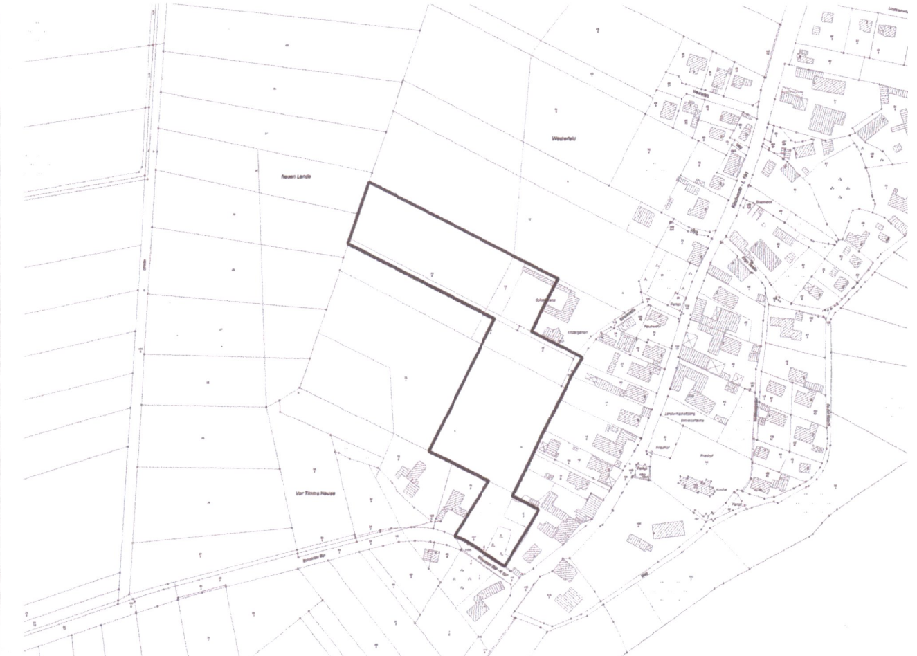
Übersichtsplan M. 1:5000

Ausgearbeitet im Auftrag der Gemeinde Gilten: