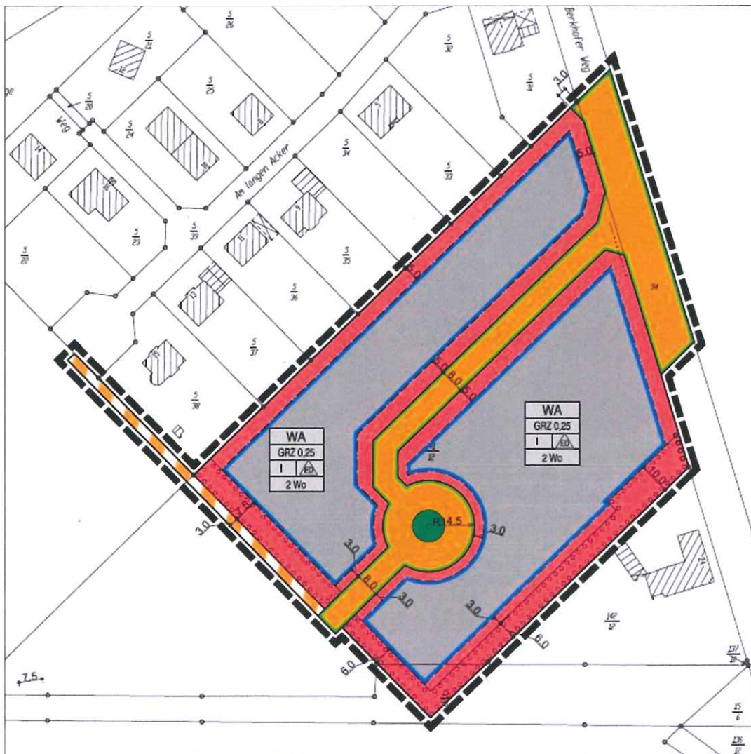
Abbildung 1: Auszug B-Plan Nr. 20 „Berkhofer Weg II“ in Marklendorf mit örtlichen Bauvorschriften (unmaßstäblich)

Der bestehende Bebauungsplan Nr. 20 „Berkhofer Weg II“ in Marklendorf mit örtlichen Bauvorschriften setzt für den Änderungsbereich ein Allgemeines Wohngebiet und öffentliche Verkehrsflächen und Verkehrsflächen mit der besonderen Zweckbestimmung „Fuß- und Radweg“, sowie Pflanzstreifen gem. § 9 Abs. 1 Nr. 25a BauGB fest.