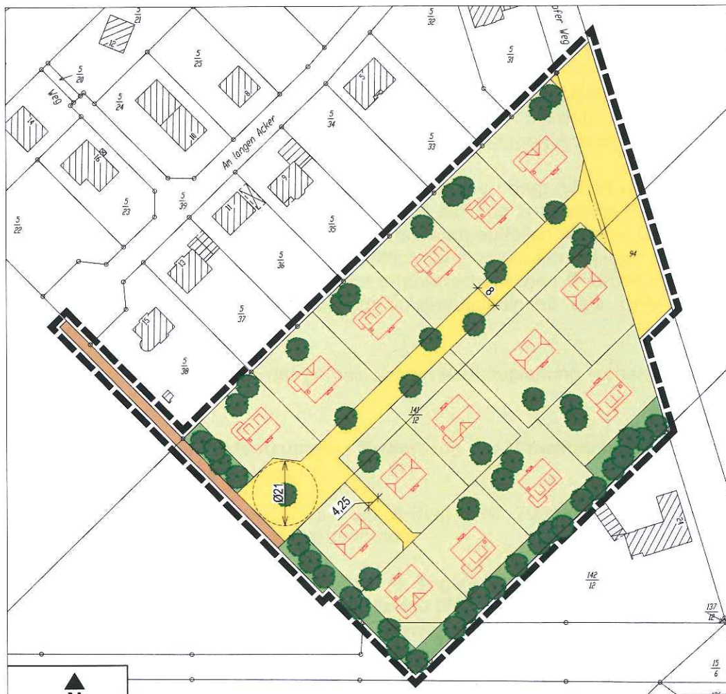
Abbildung 3: Städtebaulicher Entwurf zur geplanten Erschließungssituation (H&P Ingenieure GbR, 2017)

Der Wendehammer im südwestlichen Bereich ermöglicht das problemlose Durchfahren für Entsorgungsfahrzeuge sowie auch für Rettungsfahrzeuge. Die genaue Gestaltung bleibt der Ausbauplanung vorbehalten.